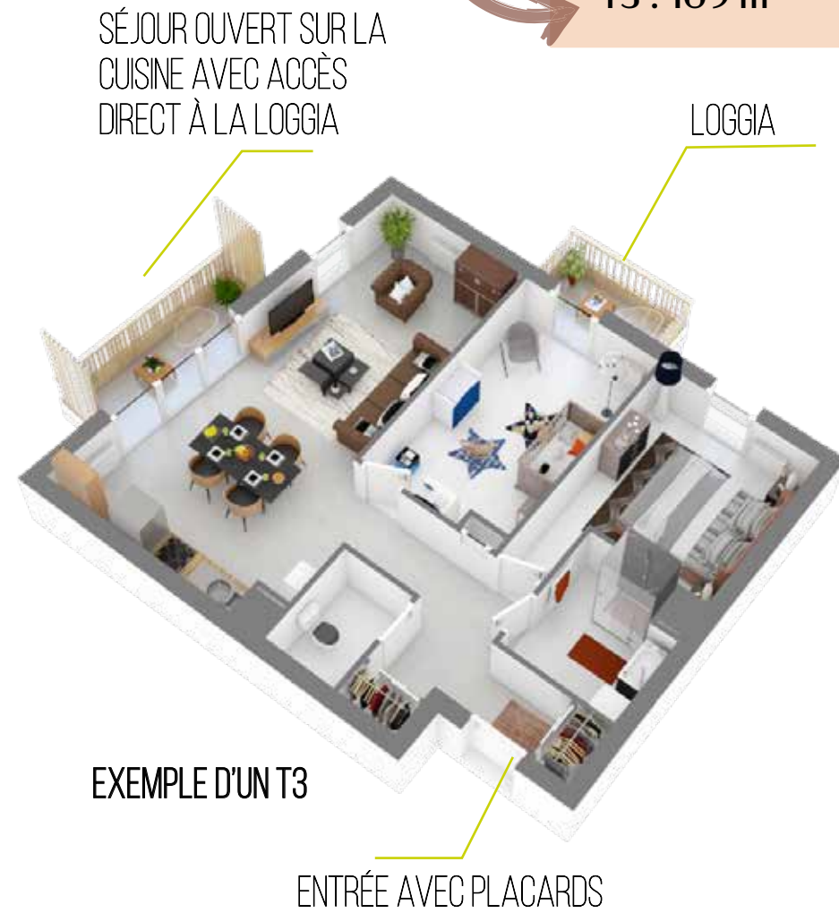
EXEMPLE D'UN T3